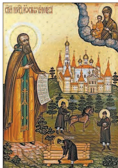
Иосиф Волоцкий. Икона