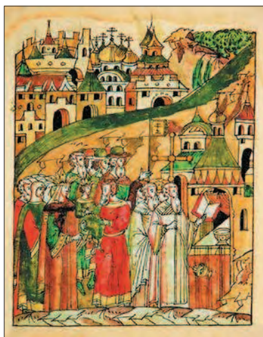
Василий III, Елена Глинская, царевич Иван при освящении храма Вознесения в Коломенском. Миниатюра. XVI в.

4. Скандальный развод. У Василия III долгое время не было наследников. Это грозило губительными последствиями — междоусобной борьбой братьев великого князя за престол. Так что неурядица в великокняжеском тереме выходила за рамки семейной трагедии.