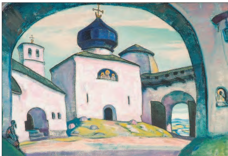
Старый Псков. Художник Н. К. Рерих

Василий III унаследовал страну на подъёме. Однако процесс собирания русских земель вокруг Москвы не был завершён. Ещё оставались формально самостоятельные земли и княжества. Не был очевиден исход противостояния с соседними странами, в первую очередь с Великим княжеством Литовским. В 1503 г. Ивану III удалось заключить мир с польско-литовским государством. Однако затишье было недолгим. Вскоре возобновились военные действия. Удача сопутствовала Василию III. Заключённый в 1508 г. договор закрепил за Москвой земли по верхней Оке, которые ранее отпали от Литвы и перешли под власть московских правителей.