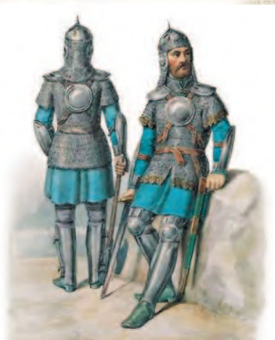
Русские воины XVI в. Художник Ф. Г. Солнцев

Воспользовавшись ослаблением Крымского ханства, Василий III развернул наступление на Казань. В 1523 г. он основал близ Казани крепость Васильсурск — важный опорный пункт, нацеленный в сердце ханства. После нескольких лет упорной борьбы великому князю удалось утвердить на престоле своего ставленника. Однако ситуация постоянно выходила из-под контроля. Было очевидно, что достичь спокойствия на востоке дипломатическими средствами едва ли удастся.