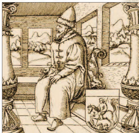
Василий III. Гравюра из книги С. Герберштейна «Записки о Московии». 1556 г.

Однако даже такая ситуация не устраивала московского князя. Он желал стать единственным «государем» в Русской земле. Это выражалось в неослабном стремлении Василия III теснить в правах своих братьев. Долго