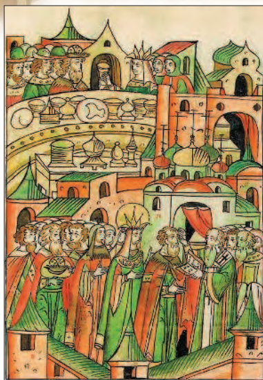
Венчание Василия III и Елены Глинской. Миниатюра. XVI в.