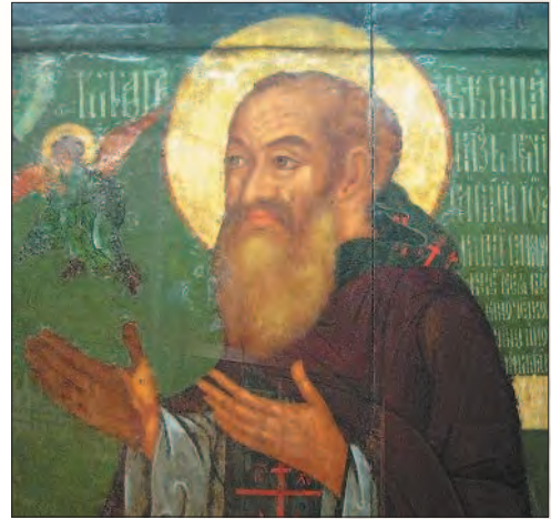
Василий III. Икона. Фрагмент

1. Отец и сын. По мнению большинства историков, Василий III (1505—1533) как личность и государственный деятель сильно уступал своему отцу Ивану III. Возможно, здесь дело не только в несомненно меньшей талантливости сына: Василию III выпало завершать то, что было начато его отцом. Но к решению новых задач, требующих проявления особых дарований, великий князь приступить не успел. Тем не менее именно в годы его княжения окончательно вызрели глобальные вызовы, ответы на которые пришлось искать уже другому правителю.